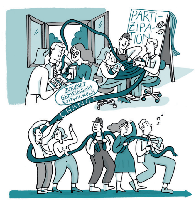
Abb. 3: Veränderungsprozesse, die als gemeinsames Projekt gestaltet sind, machen Erfolg erlebbar.

phase. Der Einführungsprozess wird getreu diesem Schema auf alle Unternehmensbereiche übertragen, so dass das Verkehrsunternehmen nach weiteren fünf Monaten eigenständig und vollumfänglich mit Asana arbeiten kann.