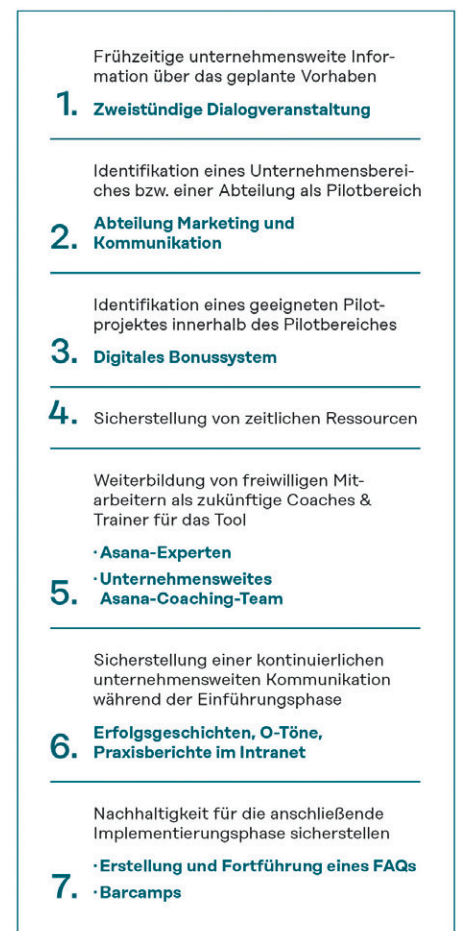
Abb. 1: Sieben Spielregeln für den erfolgreichen Einführungsprozess eines Projektmanagement-Tools.

Die Abteilung Marketing und Kommunikation, die aus den Bereichen Interne Unternehmenskommunikation (neun Mitarbeiter), Marketing (zehn Mitarbeiter), Vertrieb